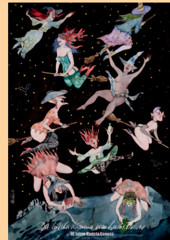
Bild rechts unten: Die eigens zum Jubiläum entworfene Sonderbriefmarke.